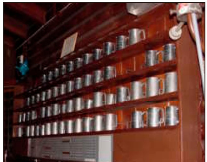
Het Zilverlingen pullenrek op de tweede verdieping van ons clubhuis. Ontwerp: Hans Beerendonk.

jaar lid zijn, staan op een gouden plaatje aangegeven. Een Zilverling blijf je altijd. Sommige Zilverlingen -o.a. diegenen die op leeftijd zijn- zijn helaas niet meer in staat zijn om regelmatig naar het clubhuis te komen. Er is jaarlijks een Zilverlingen bijeenkomst om de nieuwe Zilverlingen in te wijden tijdens een gezellig samenzijn. Elke nieuwe Zilverling wordt dan door een Zilverling persoonlijk toegesproken.