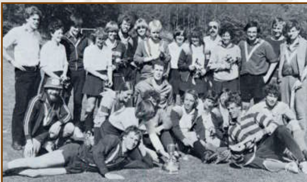
Een plaatje dubbel-op, de dames van Pinoké I en de mannen van Pinoké III die de J. D. Tresling-beker wonnen na een 2—1 zege op Apeldoorn IV.